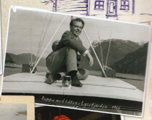
Pappa med båten i Lysefjorden 1966