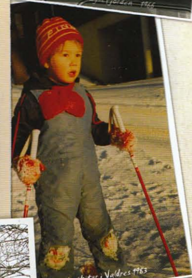
Sin første skitur i Valdres 1983